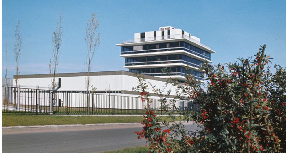
Entreprise Tricault, zone d'activités de Trappes-Élancourt, années 1970. Architecte : Alain Pierre.